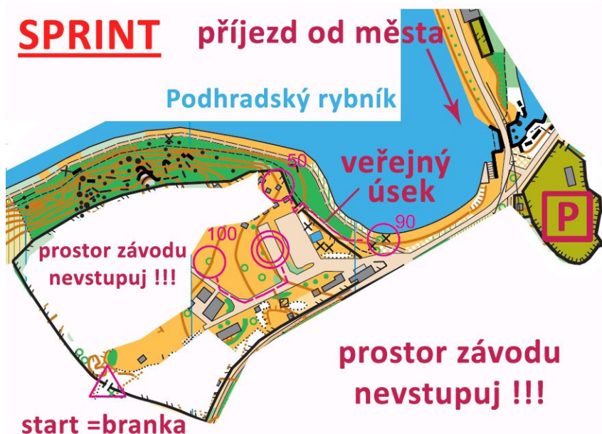
Plánek - SPRINT

DODRŽUJTE VYMEZENÉ PROSTORY (VIZ. PLÁNKY) DO KTERÝCH NEVSTUPUJTE MIMO VLASTNÍ ZÁVOD !